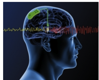
Gehirnimplantate könnten eines Tages über die sogenannte

Bei den bisher am Universitätsklinikum Freiburg durchgeführten Versuchen muss der Patient jeden Schritt der Bewegung eines Cursors einzeln und bewusst steuern. In einigen Jahren, so die Wunschvorstellung, soll er eine Prothese bewegen können – und der bloße Gedanke an die Teetasse auf dem Tisch soll genügen. Die Neurotechnologie könnte auf diese Weise dazu beitragen, dass querschnittsgelähmte Patienten oder Menschen nach einem Schlaganfall in ihrem Alltag wieder Dinge tun können, die für sie sonst nicht möglich wären. Und dann gibt es für die Schnittstellentechnologie zwischen Gehirn und Maschine noch weitere potenzielle Einsatzgebiete. „Zum Beispiel sind